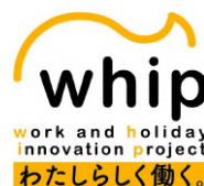
社員ワーキンググループ「WHIP」ロゴ

国内旅行、海外旅行のジャルパックは、なによりも「お客さま視点」を大切に、「旅のプロ」としてお客さま・旅行会社のみならず常々指名される旅行会社を目指してまいります。また、JAL グループの一員としてコンプライアンスを遵守し、社員一同団結して広く社会に貢献するべく努めてまいります。