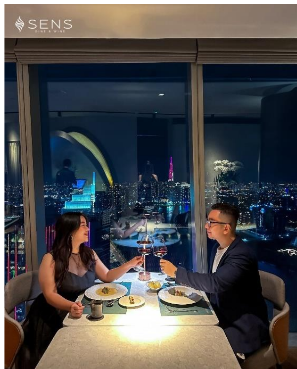
ホーチミンの夜景と楽しむ夕食プラン（イメージ）