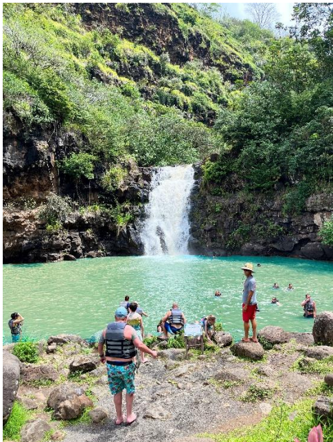
海も山も！ハワイの自然を体感する旅（イメージ）

ハワイの大自然を体感することができるマラマハワイ体験や秋の絶景カナダを添乗員と巡る海外ツアーをはじめ、国内ツアーでは石垣島で星空を観察するお子さま向けのサマースクールや沖縄で人気の「あそぼう」シリーズから初登場となる「北海道をあそぼう」など、特別企画ツアーを続々発売予定です。