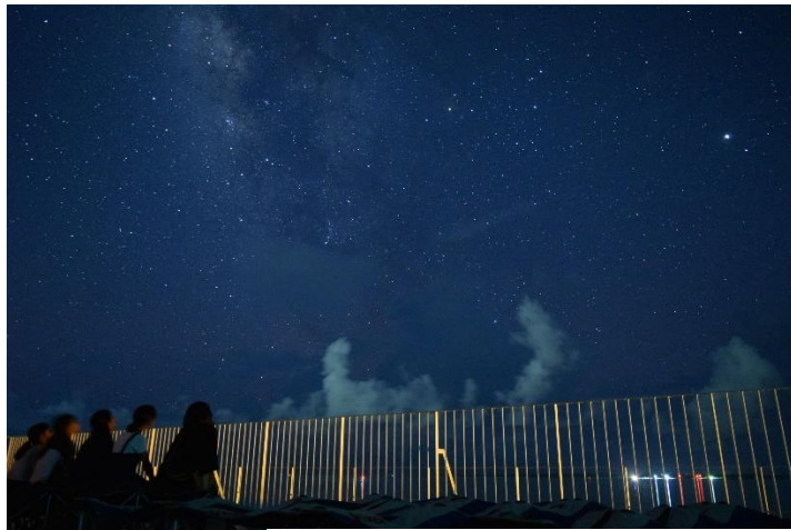
「星の島」石垣島で星空サマースクール（イメージ）